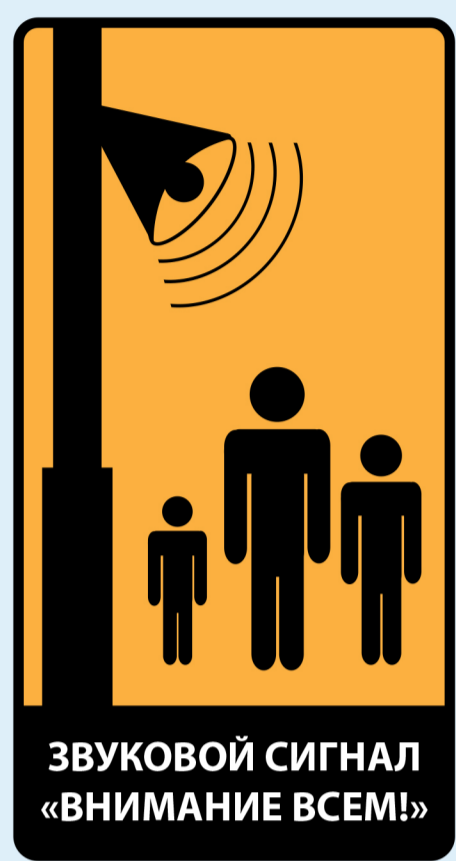
ЗВУКОВОЙ СИГНАЛ «ВНИМАНИЕ ВСЕМ!»